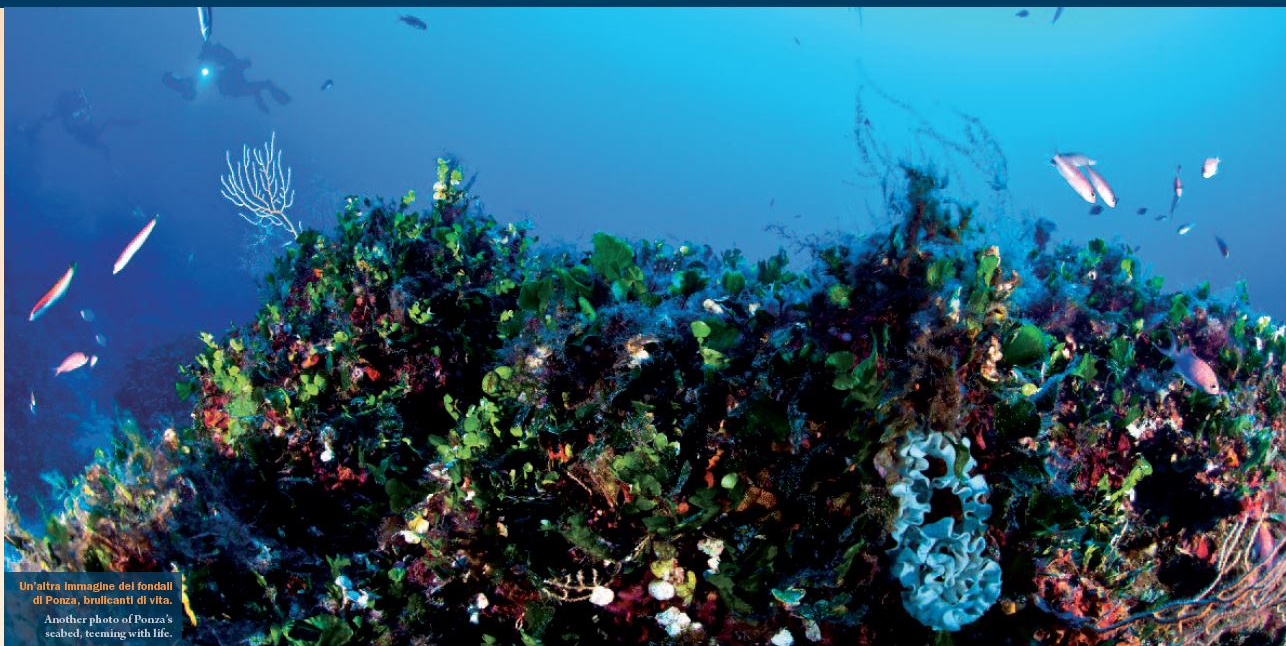
Un'altra immagine dei fondali di Ponza, brulicanti di vita.

Acquazzurra Roma, 06.76961193, 335.6875440, info@acquazzurra.it, www.acquazzurra.it