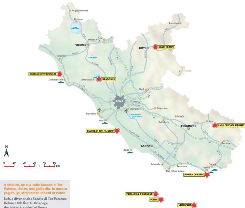
A sinistra, un sub sulle Secche di Tor Paterno. Sotto, una gollinella. In questa pagina, gli straordinari fondali di Ponza. Left, a diver on the Secche di Tor Paterno. Below, a tub fish. In this page, the fantastic seabed of Ponza.

C on la sua lunga costa e con le sue isole, il Lazio ha nel mare altrettante bellezze quante ne possiede nell'entroterra. Se il tratto centrale della regione è privo di siti interessanti per le immersioni, a nord e a sud ci sono autentici paradisi per gli amanti di quest'attività. In particolare esistono splendidi siti nel tratto di costa intorno a Civitavecchia. Qui si possono esplorare bei fondali rocciosi ricchi di flora e di fauna sottomarina, e si possono visitare i relitti di alcune imbarcazioni affondate nell'ultima guerra.