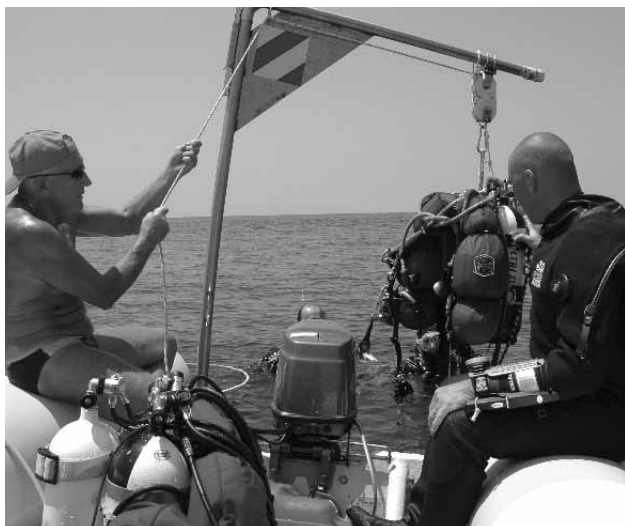
Fasi dell' "Operazione Viminale 2004".